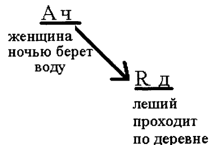
Сюжетная схема № 1.

Первичная амплификация происходит за счет присоединения коррелирующего элемента — реакции человека на проявления демона (Rч) либо акции человека (Ач), по отношению к которой действие демона, в свою очередь, — ответная реакция (Рд). Например: «Женщина рассказывала, как леший по деревне прошел. Он выше домов, а за ним ветер по деревне идет. Эта женщина ночью воду черпала. А ночью воду нельзя черпать» 9 (сюжетная схема № 1).